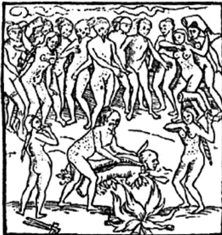
O esquitejamento do corpo do prisioneiro.

18. A imagem abaixo apresenta um ritual antropofágico de um povo indígena do território onde hoje é o Brasil.