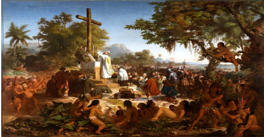
"A Primeira Missa no Brasil", de Victor Meirelles, óleo sobre tela de 1861.