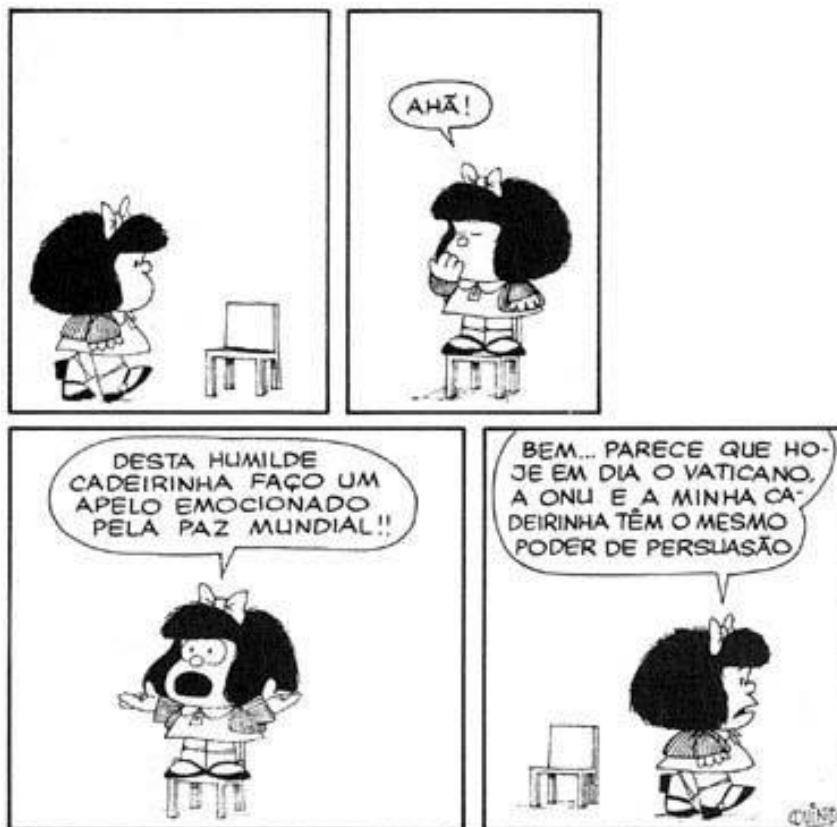
Tirinha da Mafalda em crítica à ONU

A tirinha acima considera que a Organização das Nações Unidas: